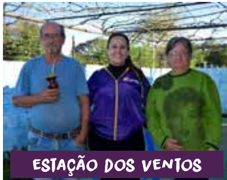
ESTAÇÃO DOS VENTOS