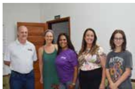
NOSSA SRA. DE LOURDES