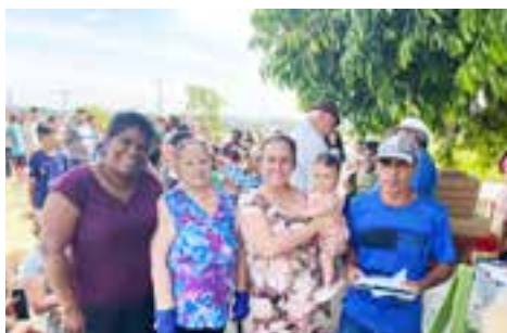
ALTO DA BOA VISTA