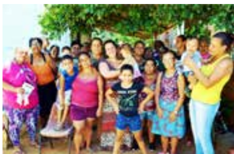
NOVA SANTA MARTA