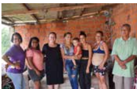
ALTOS DA LORENZI