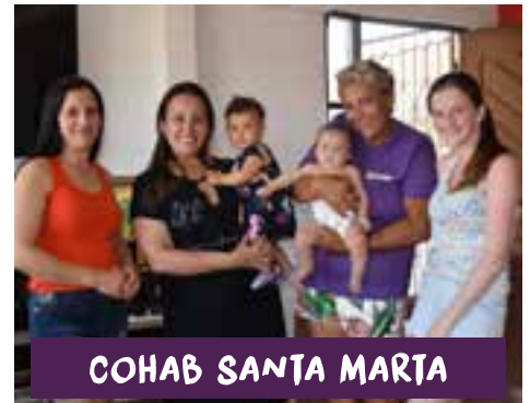
COHAB SANTA MARTA