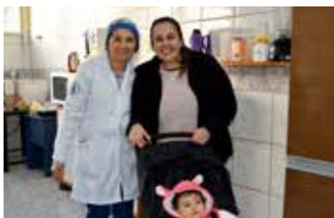
CHÁCARA DAS FLORES